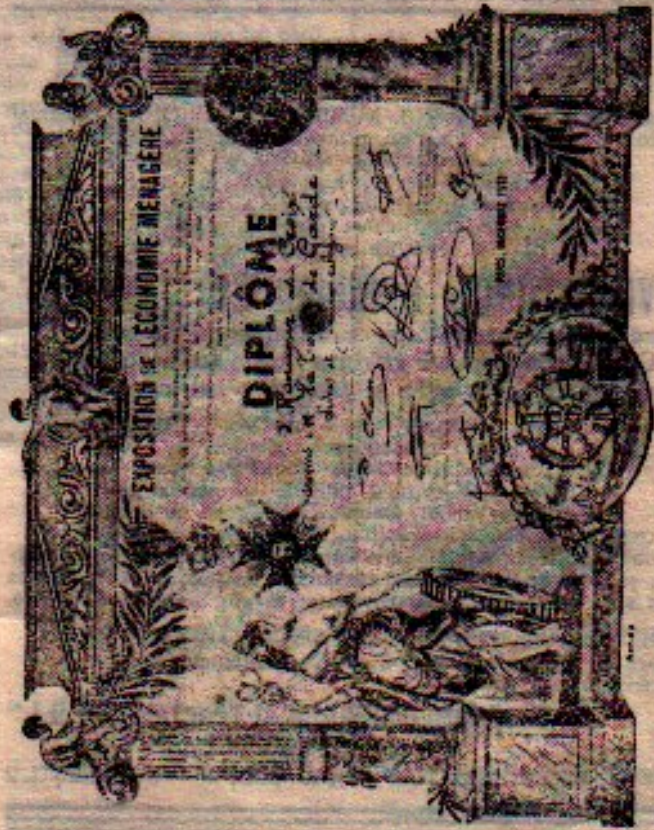
Broşurile cu text în limba franceză, sunt premiate la Expoziția din Paris.