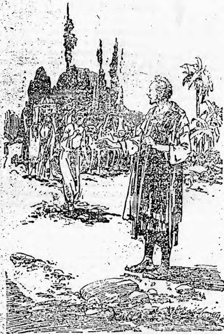
Reprezentarea căsătoriei lui Christos și a miresei sale. Pag. 42

meie. Țara de naștere a lui Avraam a fost Mesopotamia. Avraam a însărcinat pe robul său să meargă în țara sa de naștere și acolo să caute și să aducă o femeie pentru fiul său Isac. Ca dovadă că aici a fost vorba de un contract care a trebuit încheiat între femeia aleasă și Isac, este scris că servul lui Avraam s'a informat ce trebuie să facă dacă femeia nu va consimți, la care Avraam a răspuns: „Dacă femeia nu va voi să te urmeze, atunci ești deslegat de jurământul sau obligațiunea ta”. Consimțirea ambelor părți contractante este de lipsă la încheierea contractului.